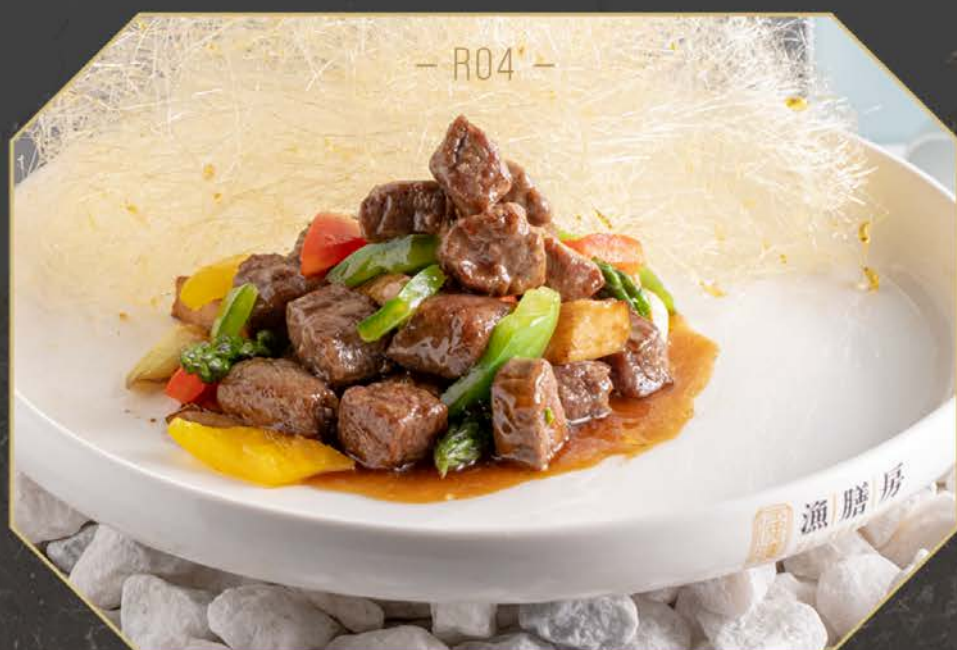
R04 泰椒葱爆牛仔肉 🌶️