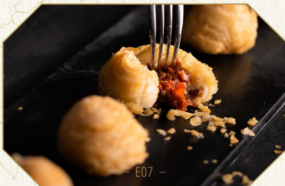
E07 酥化安格斯牛酥 [三件]