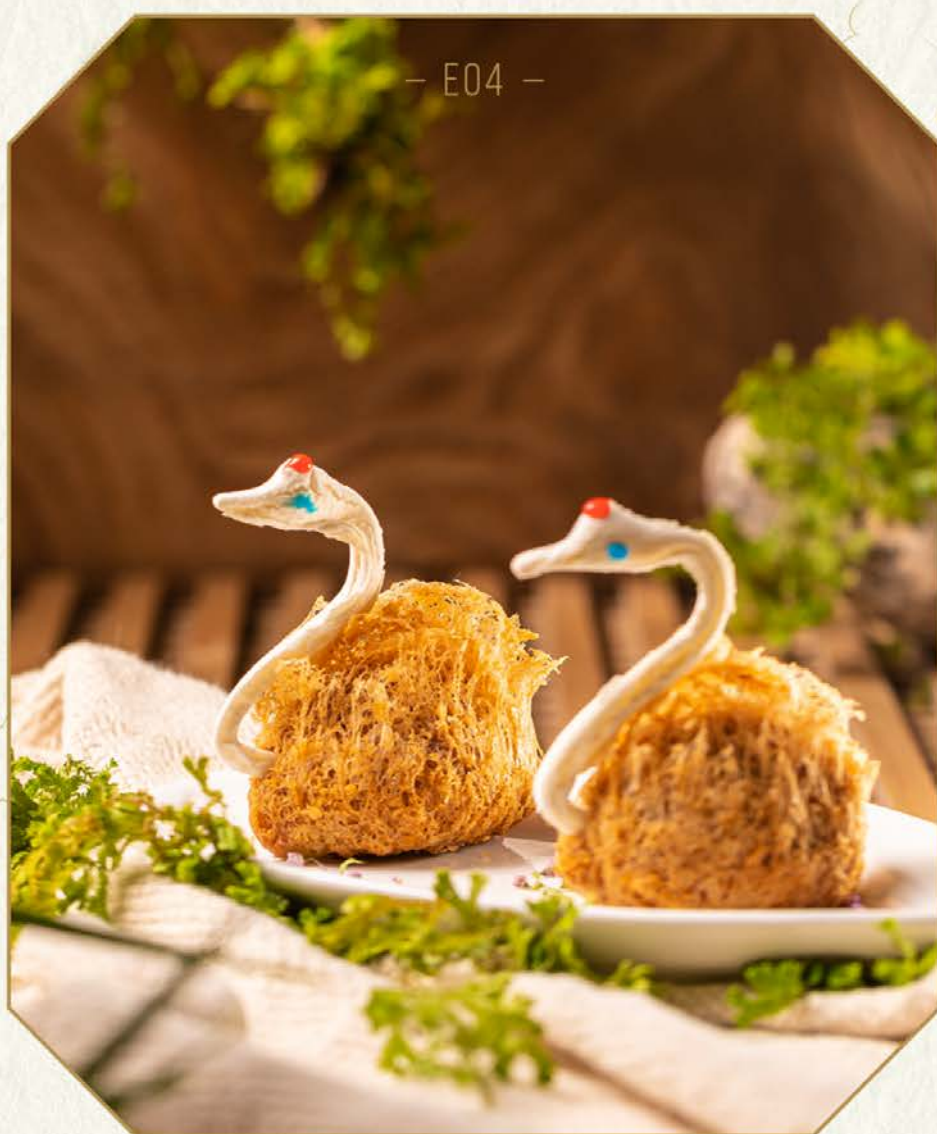
E04 俪影一双 [两件] 五香蜂巢芋角