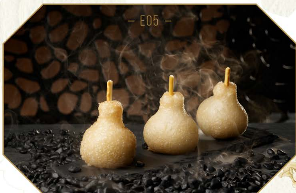
E05 金梨咸水角 [三件]